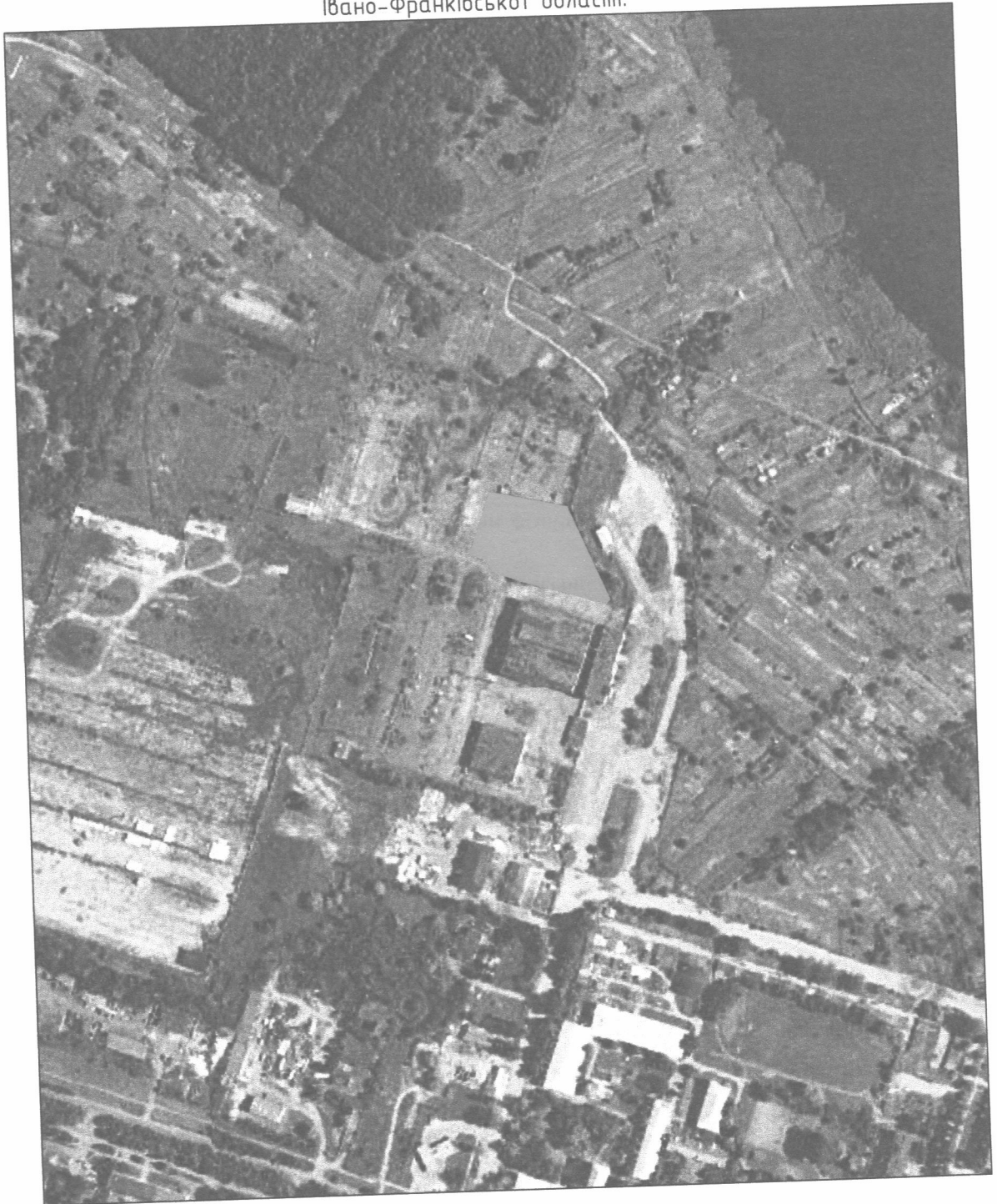
СХЕМА РОЗМІЩЕННЯ ЗЕМЕЛЬНОЇ ДІЛЯНКИ ТОВАРИСТВО З ОБМЕЖЕНОЮ ВІДПОВІДАЛЬНІСТЮ "ВВТ АВТО" 12.04 – для розміщення та експлуатації будівель і споруд автомобільного транспортного та дорожнього господарства на території міста Калуш Івано-Франківської області.