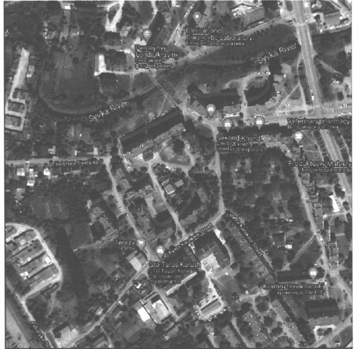
СХЕМА РОЗТАШУВАННЯ ЗЕМЕЛЬНОЇ ДІЛЯНКИ