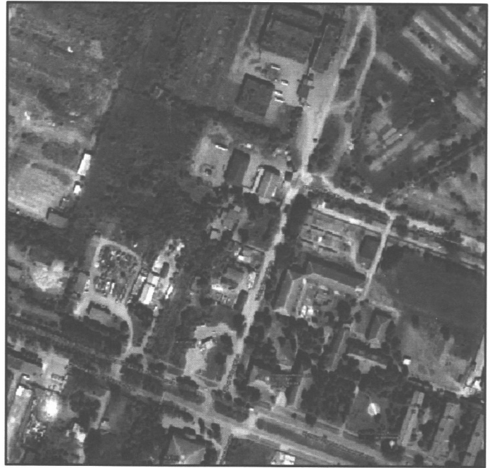
СХЕМА РОЗТАШУВАННЯ ЗЕМЕЛЬНОЇ ДІЛЯНКИ