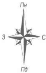
СХЕМА ПОДІЛУ ЗЕМЕЛЬНОЇ ДІЛЯНКИ

Кадастровий номер земельної ділянки - 2610400000:15:001:0050