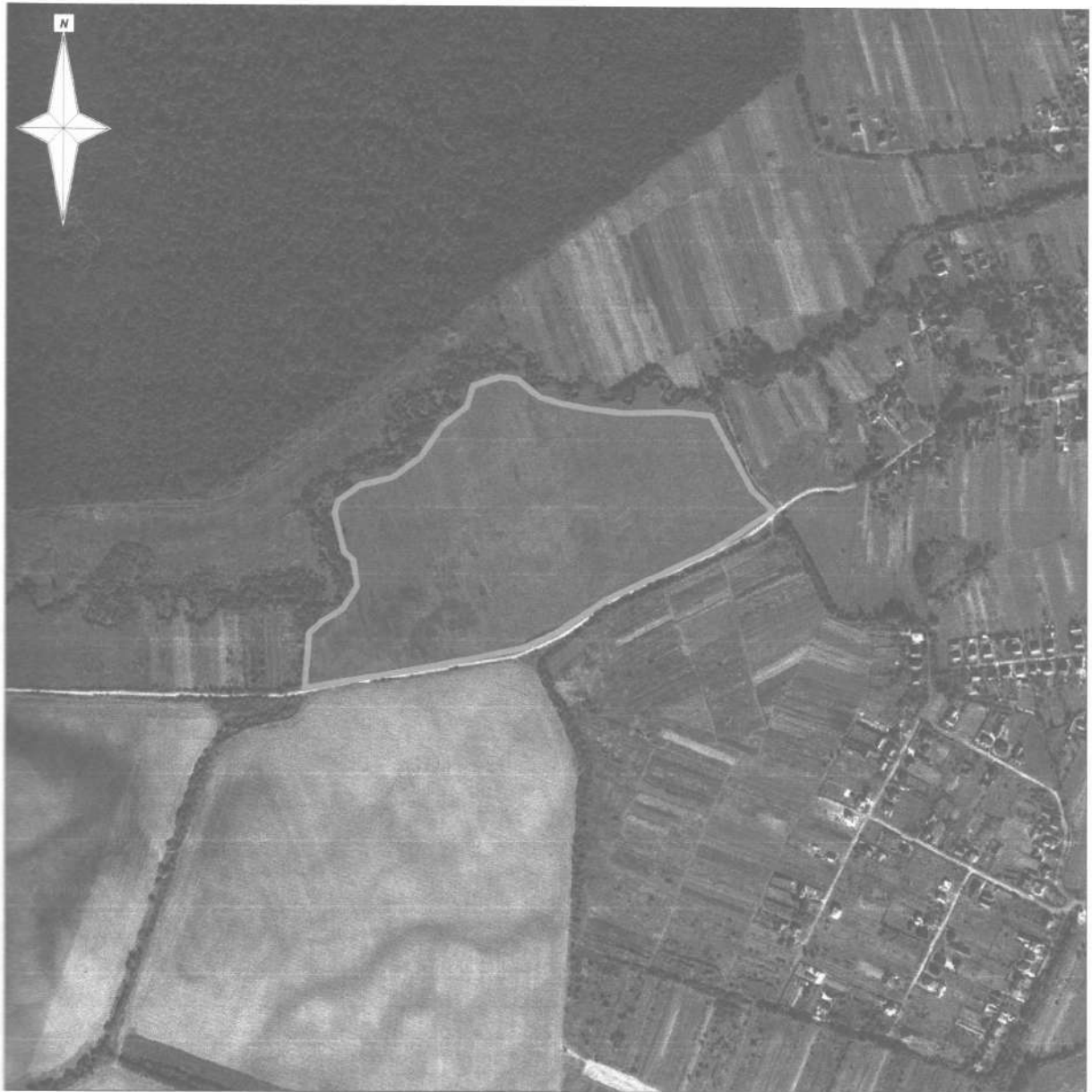
СХЕМА РОЗМІЩЕННЯ Калуська міська рада, село Копанки Калуського району Івано-Франківської області