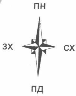
Схема планувальних об