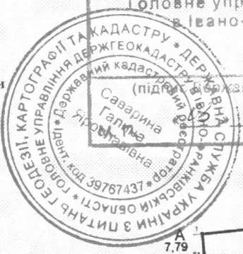
ТАБЛИЦЯ КООРДИНАТ поворотних точок меж земельної ділянки