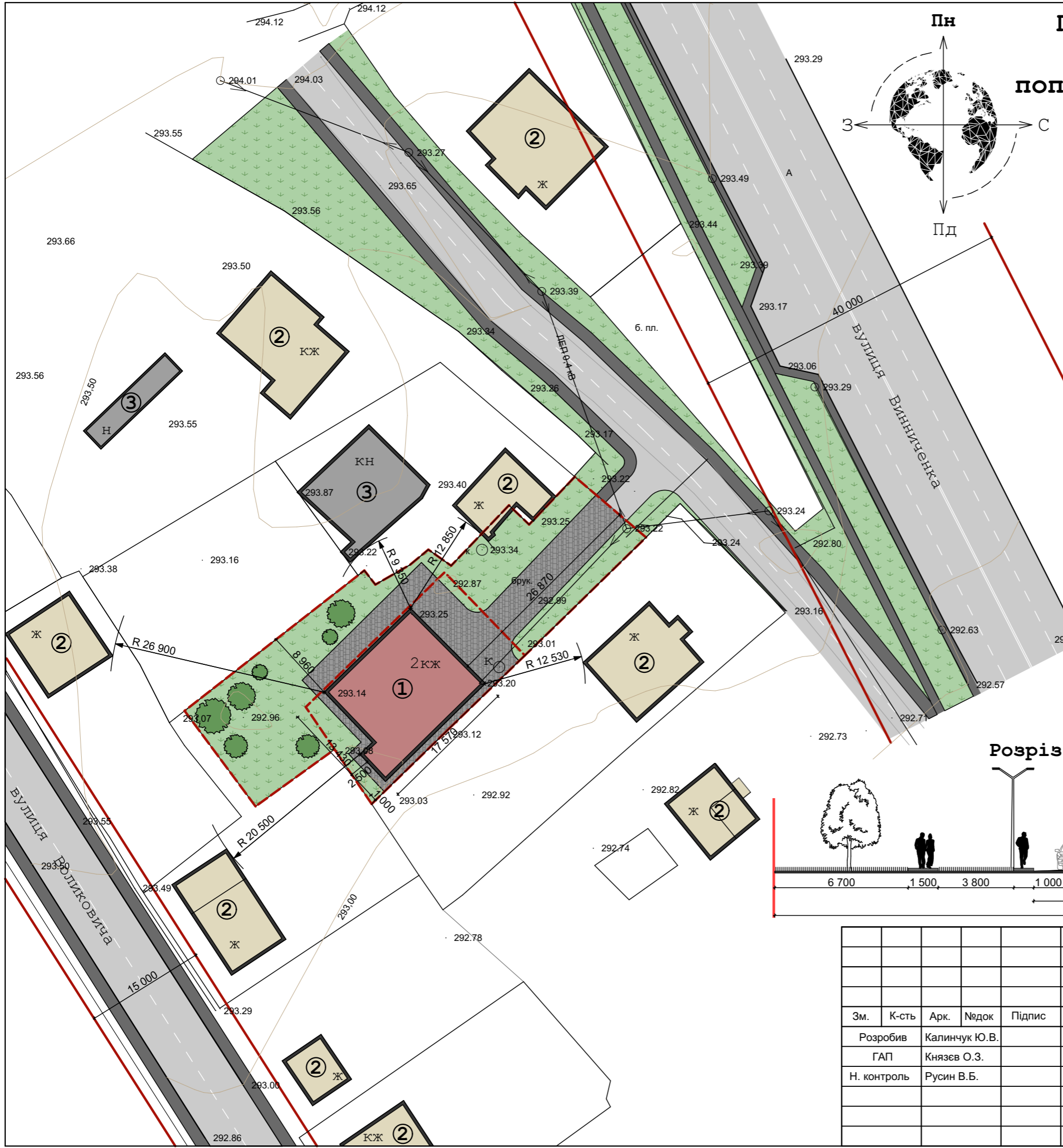
Розріз вул. Винниченка М 1:200